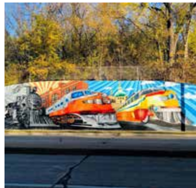
Mural sobre la calle sur de la 6 y la avenida oeste de la Oklahoma

¿En qué consiste y por qué se realiza? Recomendación de integrar el arte de toda el área de planificación en forma estática y funcional en el ámbito público. El arte ayuda a crear un sentido de pertenencia y hace que los lugares sean más agradables para todos. El arte público es accesible e interesante para todas las edades, lo que ayuda a crear entornos favorables para las familias. El aumento de las oportunidades para fomentar el arte y el desarrollo de artistas locales ayuda a formar una comunidad, generar interés e impulsar la inversión en los corredores. Cuando el arte refleja la comunidad, se produce un empoderamiento y sentido de pertenencia comunitario.