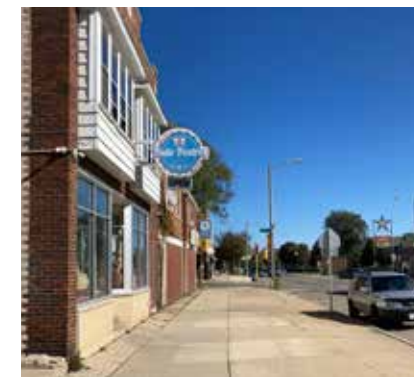
Todo Postres en la avenida oeste de la Oklahoma

¿En qué consiste y por qué se realiza? El BID, con el apoyo de los corredores comerciales del DCD, seguirá fomentando una gran variedad de negocios, incluidos aquellos que son favorables para las familias. La diversidad de los negocios, especialmente de los negocios locales, es única en esta área y es apreciada por las comunidades residencial y comercial.