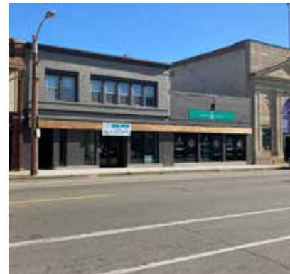
Urbal Tea después de implementar la subvención de fachadas