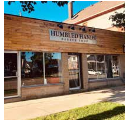
Humbled Hands después de implementar la subvención de fachadas