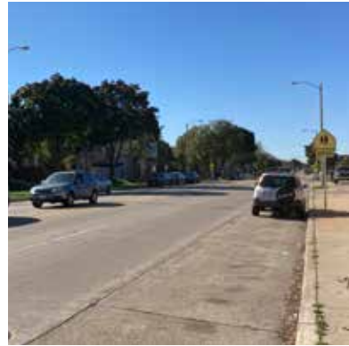
La avenida oeste de la Oklahoma, entre la plaza sur de la 9 y la calle sur de la 10

¿En qué consiste y por qué se realiza? Los proyectos de control de inundaciones del río Kinnickinnick ofrecen una oportunidad para ampliar un sendero de varios usos a lo largo del río. Los senderos son caminos de baja dificultad por los que las personas de todas las edades y capacidades pueden pasear. También son una oportunidad para que los residentes y la comunidad se conecten con el sistema de senderos más amplio.