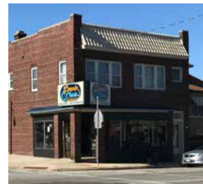
Lincoln Music en la calle sur de la 13

¿En qué consiste y por qué se realiza? El BID continuará promocionando los corredores como destino mediante campañas de marketing, y destacará los negocios a lo largo del corredor. La promoción de los negocios es fundamental a la hora de ayudar a proporcionar estabilidad a los negocios existentes y crear nuevos negocios complementarios en el área.