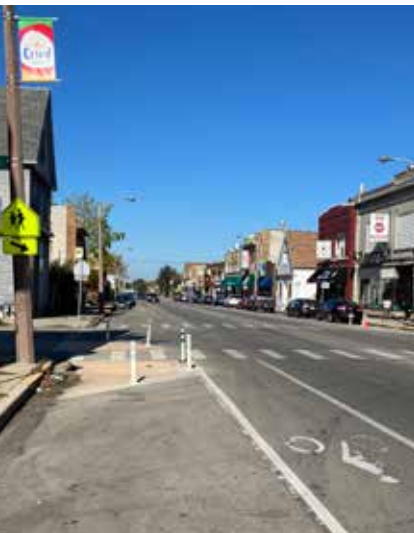
La calle sur de la 13 y la avenida oeste de la Manitoba

PLACEMAKING Y ARTE: estos proyectos incluyen mejoras visuales para los corredores y las vecindades que están en consonancia con su identidad y que promueven el área como destino local.