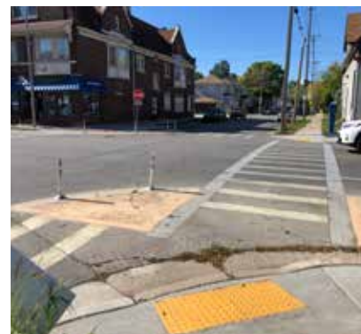
Mejoras peatonales en la calle sur de la 13 y la avenida oeste de la Dakota

Tiempo de implementación: A corto plazo (de 0 a 3 años)