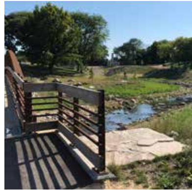
El puente y sendero del parque Pulaski