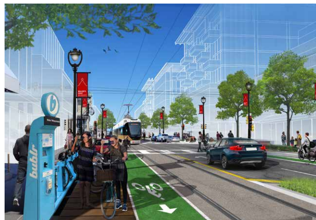
▲ Tej zaum yuav ua kom muaj kev tsheb khiav nrog rau txoj kev streetcar rau yav tom ntej