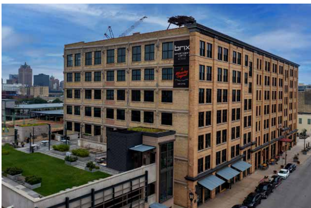
▲ Cov tsev neeg nyob thiab siv ua lag luam uas saww daws siv tau qhov chaw nyob sab nraum zoov