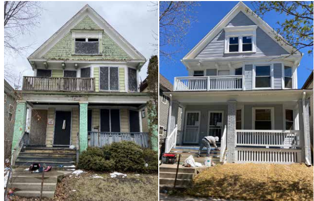
▲ Kho cov tsev txaus 2 yig nyob hauv Milwaukee, yog ib feem ntawm Homes MKE Initiative

luam, cov chaw neeg siv, thiab tej chaw uas muaj tej kev ua rau neeg siv yuav qhia tau hais tias yuav muaj tej yam yuav siv nyiaj txiag los nchuav rau tej koog tsev nyob thiab yuav muaj kev rau neeg los siv qhov ntawv ua chaw tiag taw ua lwm yam lag luam ntxiv thiab.