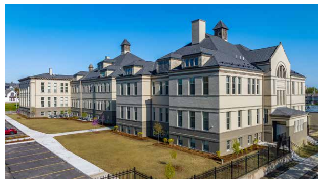
▲ Rov qab muab lub tsev kawm ntawv qub McKinley School kho ua ib lub tsev nyob pheej yeej muaj 39 chav nyob