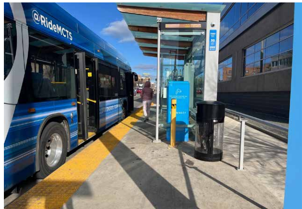
▲ Txuas 1 Bus Rapid Transit (BRT) nres nyob Wisconsin Avenue