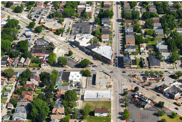
▲ Cov tsev loj siv ua lag luam ntawm kev siv tshuam W. Fond du Lac Ave., N. 35th Street, and W. Burleigh St.