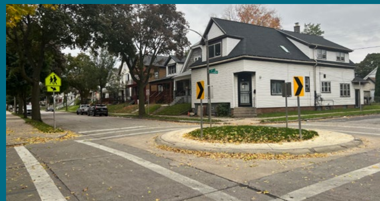
Lincoln Ave School Traffic Circle