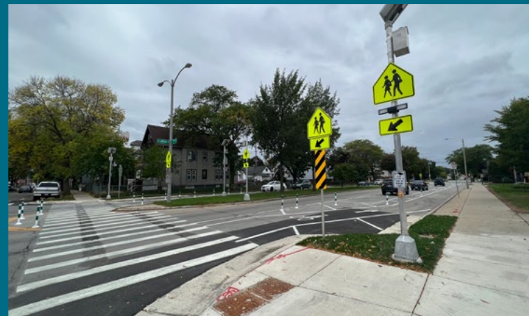
Allen-Field Crossing Improvements

Finally, we ask all of you to help make our neighborhoods safer by continuing to be engaged. Resident engagement is key. Join us at your neighborhood association meeting, MPD monthly crime trend meeting, or local community organization event. Please contact our office to get connected. ▀